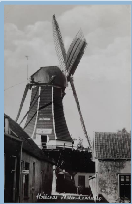
Molen de Fortuin

De molen was blijkbaar danig aan het aftakelen, wat niet alleen blijkt uit de prijsdaling. Lubberts werd namelijk door het gemeentebestuur in 1852 aangespoord om vanwege het gevaar dat de omgeving blijkbaar liep, de molen te herstellen.